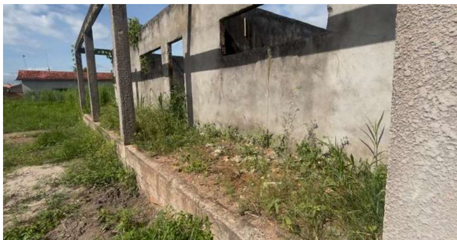
Imagem 02 – Circulação do bloco pedagógico.