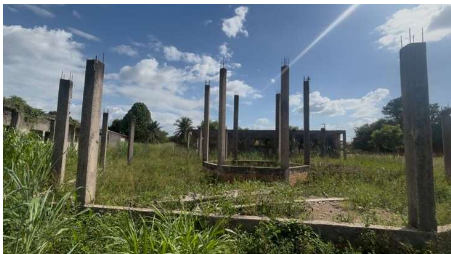
Imagem 04 – Pátio coberto.