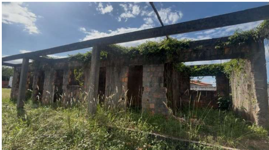
Imagem 01 – Bloco administrativo.