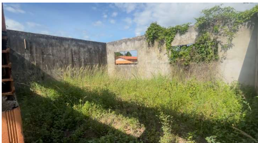
Imagem 03 – Sala de aula do bloco pedagógico.